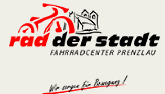
Rad der Stadt Prenzlau