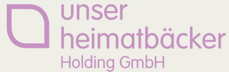
Unser Heimatbäcker Gruppe